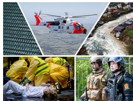
Regjeringens samfunnsikkerhetsmelding «Risiko i et trygt samfunn» 2016

Meld. St. 10 0106-2017 Melding til Stortinget Risiko i et trygt samfunn Samfunnsikkerhet