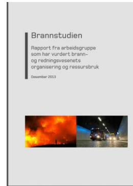
DSB «Brannstudien» 2013