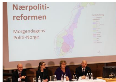
Nærpolitireformen «Morgendagens politi-Norge» 2016